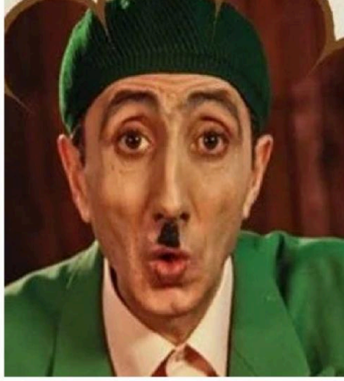
CUMHUR SEVAL TEYO EMMİYİ CANLANDIRAN TİYATRO SANATÇISI